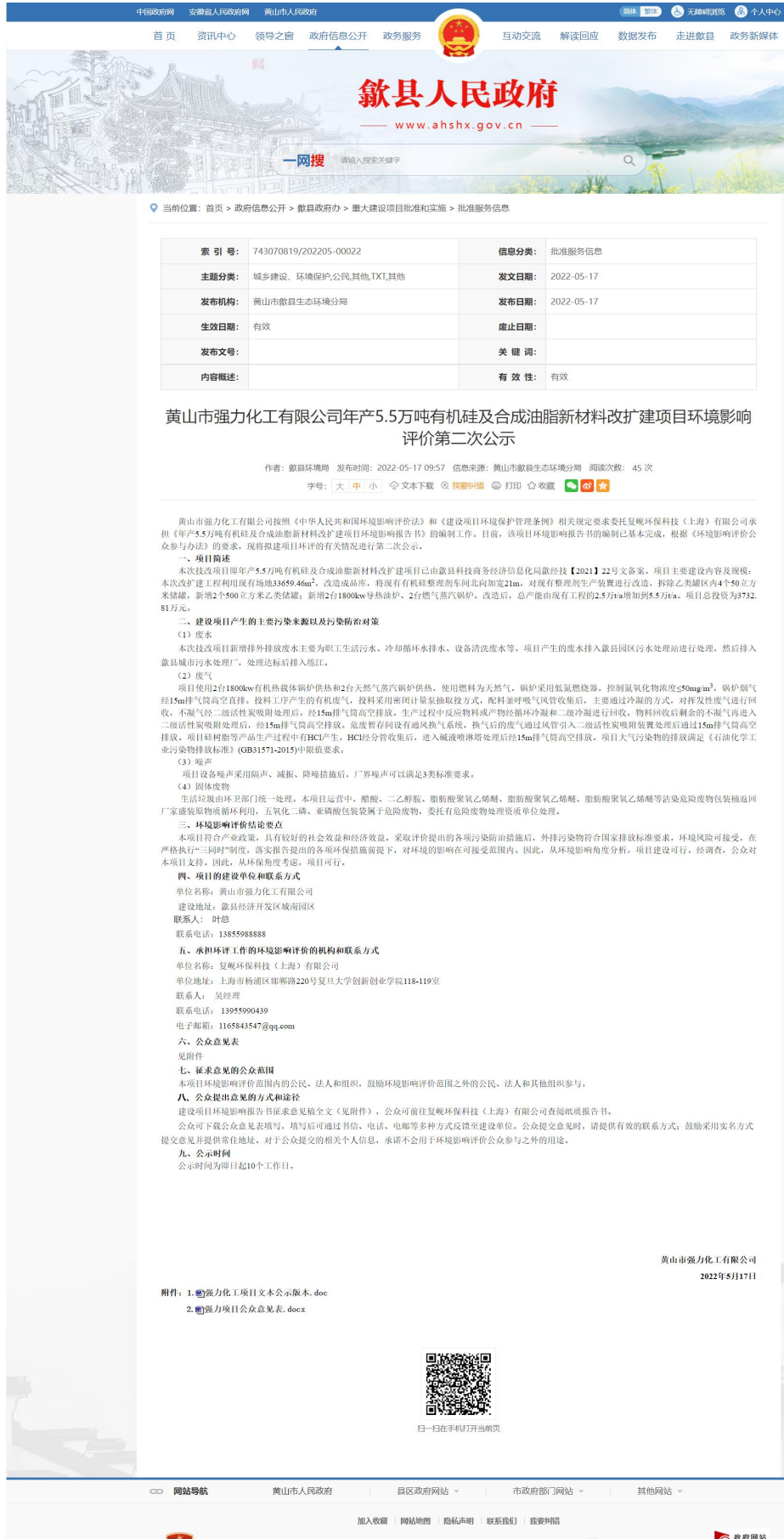
图2 第二次网络公示截图