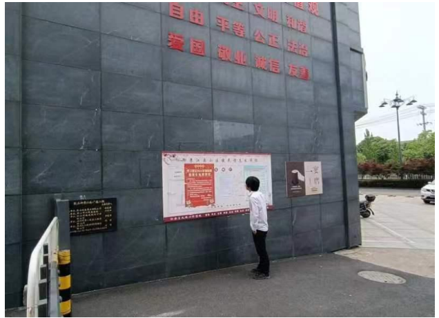
图 4 现场公示截图